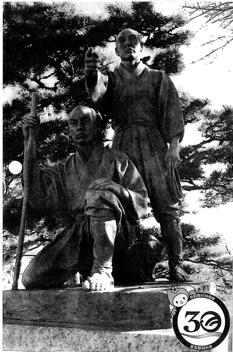
令和3年11月1日、羽村市制施行30周年 (写真: 玉川兄弟像)